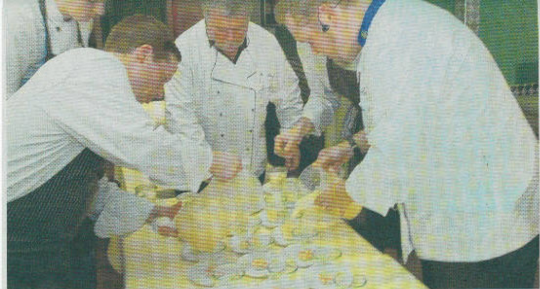
Viele Köche – den Brei haben sie wahrscheinlich jedoch nicht verdorben. In der VillaMedia ging es während der jüngsten Cooking Battle hoch her.